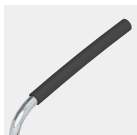
Y compris l'accoudoir avec revêtement softgrip noir