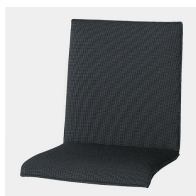
Coque de siège profilée avec rembourrage complet