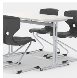
Sièges des deux côtés grâce au cadre de la colonne centrale