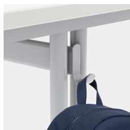
Comprend un crochet pour dossier par siège