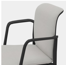
Dossier ergonomique en maille filet respirante