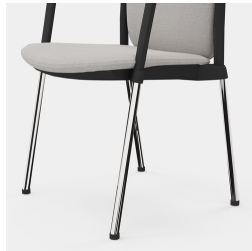
Cadre robuste en porte-à-faux