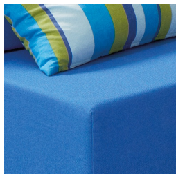
Confort maximal grâce au noyau en mousse et aux coins arrondis