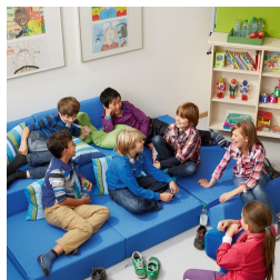
Utilisation polyvalente grâce à la fonction de pliage